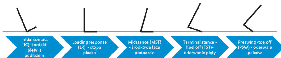
Rys. 1 Położenie stopy w fazie podporu

Drugą powszechnie stosowaną metodą pomiaru charakterystyki energetycznej jest obliczenie właściwości energetycznych z mechaniki stawowej podczas analizy chodu, wykorzystującej do tego celu platformę diagnostyczno-pomiarową, kamery emitujące promieniowanie IR oraz markery rejestrujące ruch ciała.